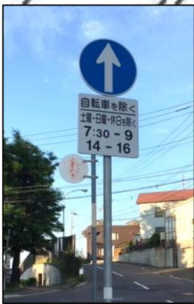
■ 印1か所に 立て看板設置