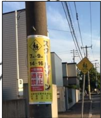
● 印5か所に 電柱巻き看板設置