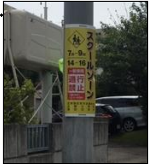
--- 線は、スクールゾーンです