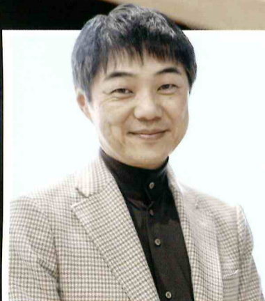
東京大学 池谷 裕二 教授