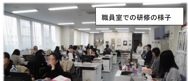
職員室での研修の様子

これらは、自殺予防の観点としてだけでなく、子どもを理解する上で、私たち大人が、毎日実践していくことができそうです。友達とのこと、学習のこと…家庭と学校とが連携しながら、子ども一人一人の心に寄り添っていきたいと思います。