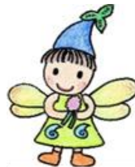
あいの里東小学校マスコット