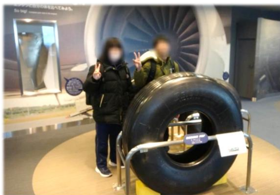
→ 大空ミュージアムにて