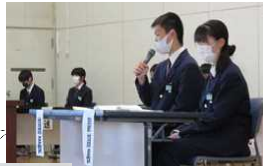
審議を 進行する 議長団

昨年度は教室で行われた生徒総会でしたが、今年は全校生徒が集まって開催することが出来ました。換気のためとはいえ、巨大な送風機がけたたましい音をたてる中、議長団の落ち着いた進行のもと静粛に行われました。