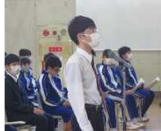
議案について いくつかの質問が だされました。