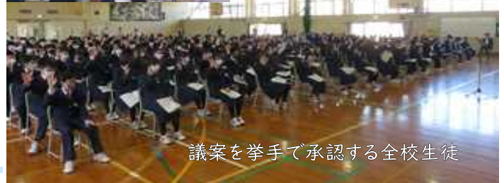
議案を挙手で承認する全校生徒