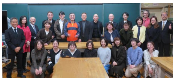
今年度の講師の方々と一緒に