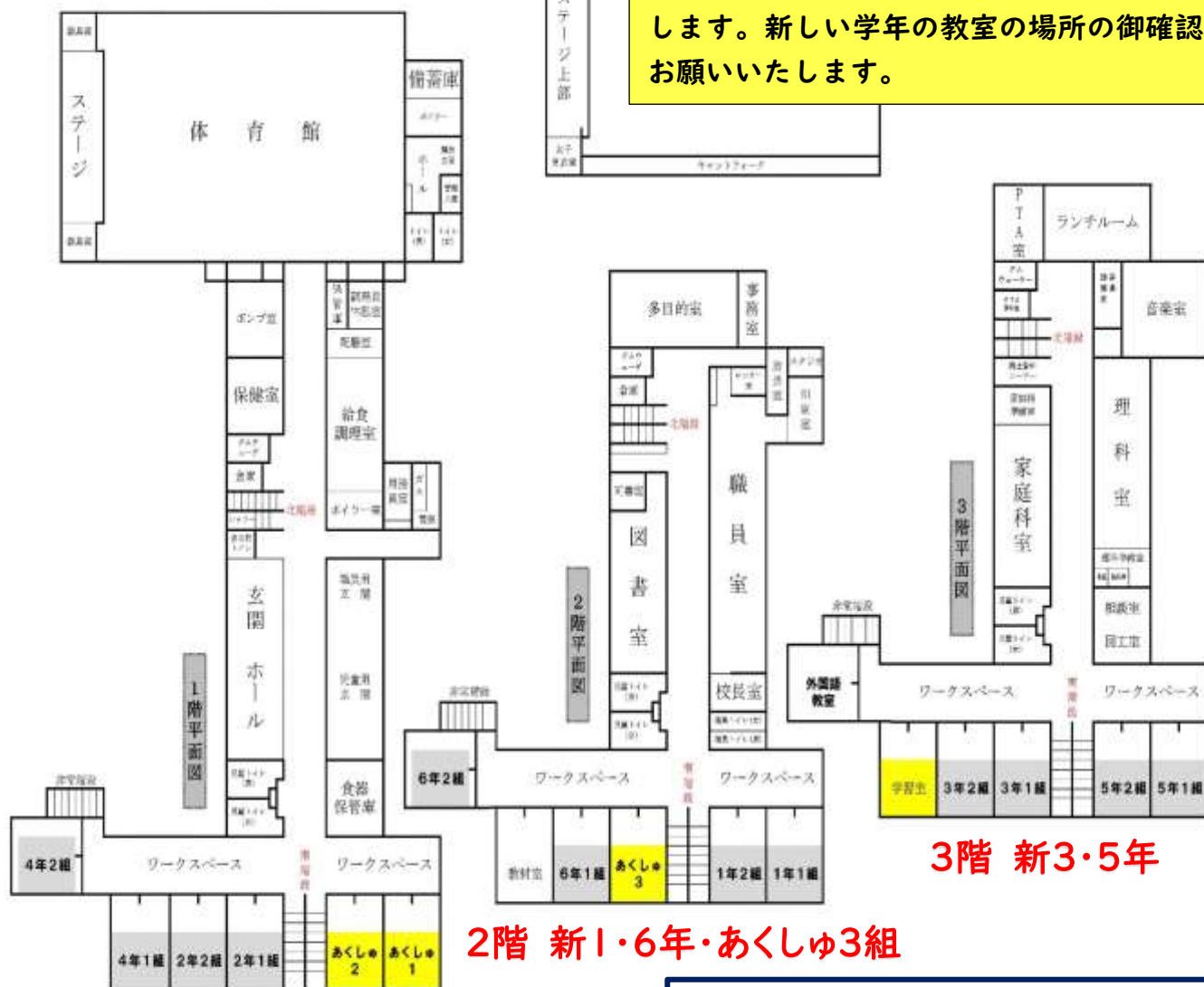
令和7年度 札幌市立厚別通小学校平面図