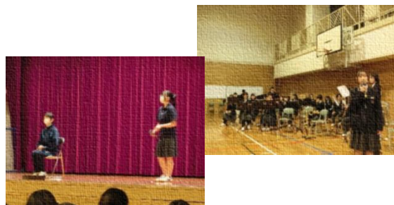
新入生歓迎会では、体育館に全校生徒が集まり、生徒会や部活動、標準服のこと等について紹介がありました。