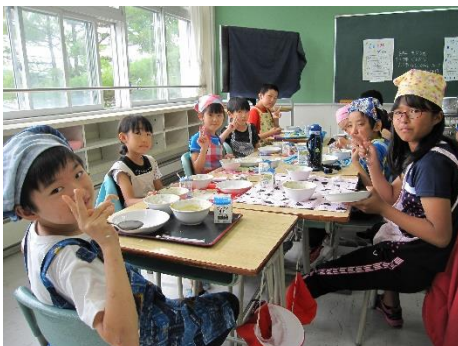
ふれあい班給食の場面です