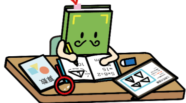
【読書】キャラクター「おっほん」