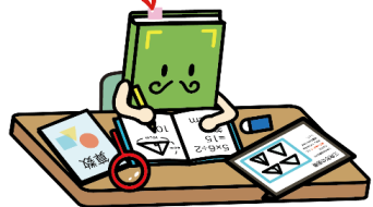
【読書】キャラクター「おっほん」