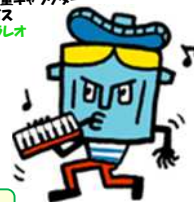
札幌市ごみ減量キャラクター さっぽろミーゴス ワケラシオ