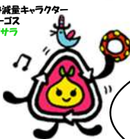
札幌市ごみ減量キャラクター さっぽろミーゴス リサラ