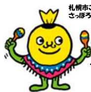
札幌市ごみ減量キャラクター さっぽろミーゴス ヘルベルト