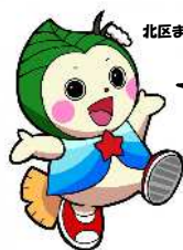
北区まちづくりキャラクター ほっぴい