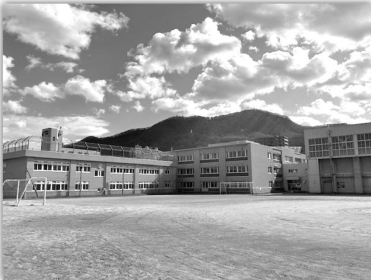
グラウンドバックネット側より見る校舎