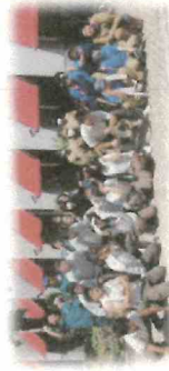
【彩活フェスパウンドケーキ販売】