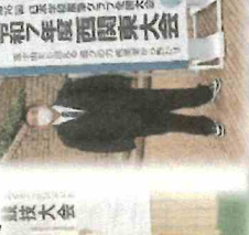
農業鑑定競技作物