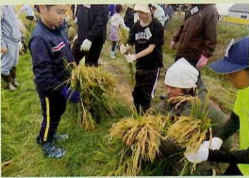
刈った稲穂をしばり出す