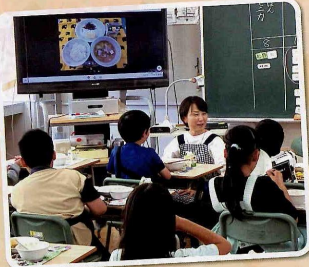
◎食指導風景：給食時間中、子どもたちに声掛けしている様子

食育授業のプログラムは多彩 食育授業では、各学年の実態や成長に合わせた食指導のテーマを決めて取り組んでいます。食べることに興味を