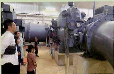
南美原揚水機場見学