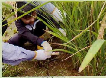
根元から上手に刈れている

「いつも食べているお米がどうやって作られているか、子どもにもじかに見せることができるとよかったです」と親御さんの声。「わたし、ごはんが好きで、特にゴマ塩のおにぎりが大好きなんです!」と、刈り取った稲穂をかかげた女の子が話してくれました。お昼は、美原若衆がおいしいおにぎりとお汁・からあげ・ポテトサラダを用意してくれました。稲刈り作業でお腹を空かせた子どもたちは、おにぎりを頬張ってニッコリ。食後は、HBCの人気キャラクターもんすけも参加してのクイズ大会で、大いに盛り上がりつつ楽しいひと時を過ごしました。