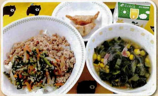
◎給食メニュー：ピビンバ、小松菜スープ、揚げぎょうざ、牛乳

人気の給食メニュー ラーメン・揚げパン・ピビンバ 変えていく調理員さんたちを「どんぐりレンジャー」と紹介し、子どもたちも興味を持って学んでいけるよう工夫。「あつ今青レンジャーさんがおいもを切っている!!」