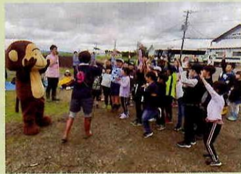
もんすけと一緒にクイズ大会