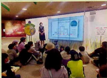
ホクレンパールライス工場見学

徹底されています。工場のエントランスに入ったら、ごはん探検ツアーのスタートです。(問題・お米1俵(60kg)が収穫できる田んぼの広さは? ①サッカーグラウンドの約1/2 ②バレーボールコート約1/2 ③卓球台の約1/2)係の人の丁寧な解説を聞きながら、館内を楽しく見学しながらクイズに挑戦しました(答え①②)。