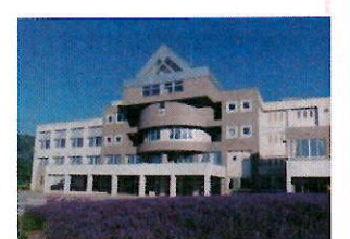
新設校は現富良野緑峰高校の校舎を利用します

富良野高校は、普通科、園芸観光デザイン科、電気情報システム科の特色を生かし、多様な進路希望への柔軟な対応や地域の教育資源の活用、DX等の最先端の学びを展開します。