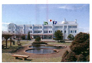
新設校は現岩見沢西高校の校舎を利用します

岩見沢東高校の文理探究科の学びは、共通教科・科目の他、学校設定科目「探究基礎」「探究応用」を通して、問いを立てて、新たな価値を創造する力を身に付けることが特徴です。