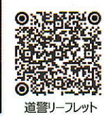
道警リーフレット