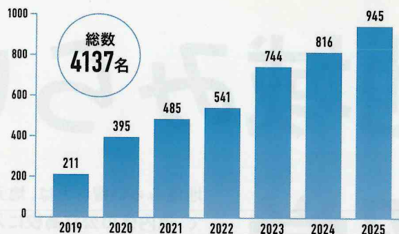
地域みらい留学生数（1年生の入学者数）

A これからの「正解のない世界」を生きていくために必要な、「自分で考え、挑戦し、自ら未来を作る機会」が地域には溢れているから。