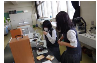
昨年の学校説明会の様子