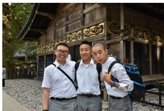
2日目 日光東照宮。三人の頭上に見えるのは、有名な「三猿」。僕も真似しようっと。