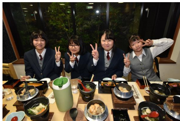
1日目 夕食会場の成田 米屋観光センターにて。釜飯ご膳でお腹いっぱい！！