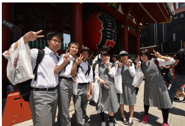
3日目 最後の研修場所浅草雷門前にて。日差しに負けないにっこり笑顔です。お土産もバッチリ！