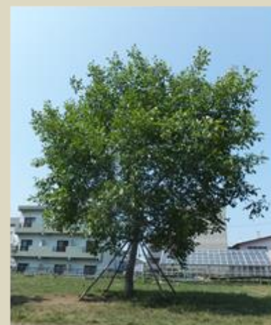
【校木 くるみ(昭和56年改定)】