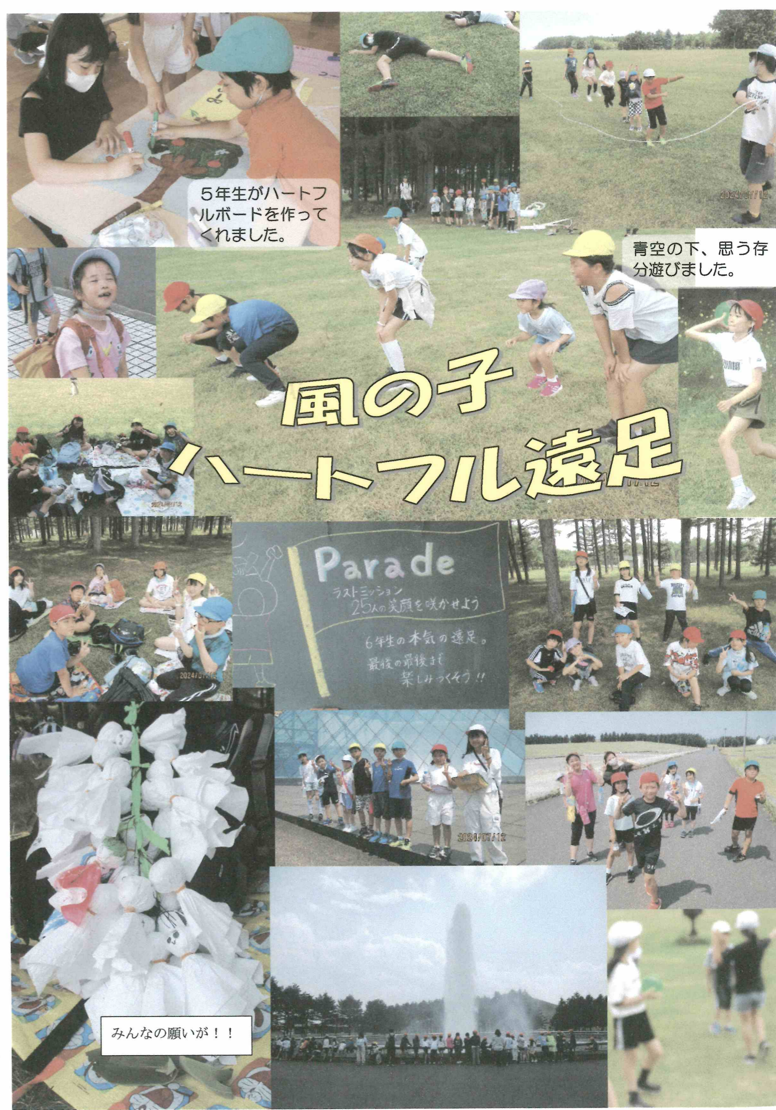
5年生がハートフルボードを作ってくれました。

札幌市では、体罰事故に対する調査の透明性及び公平性を担保するとともに、学校教育に対する信憑性の維持向上に寄与することを目的に、平成16年度より「札幌市学校体罰調査委員会」制度が発足しています。委員会は、校長が推薦する者、市PTA協議会が推薦する者、第三者委員会（校長及び市PTA協議会が協議の上推薦する者）で構成されます。学校において体罰事故が発生した場合は、調査委員会の委員立会いのもと、児童及び保護者並びに関係者から話を聴くこととなります。学校として体罰が起きないように万全を尽くしますので、皆様の御理解と御協力をお願いいたします。