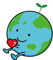
【環境】キャラクター「ちつきゅん」