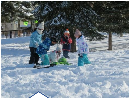
雪合戦や雪像作り、尻滑りなど様々な遊びを楽しみました