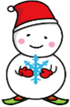
【雪】キャラクター「ゆっぽろ」