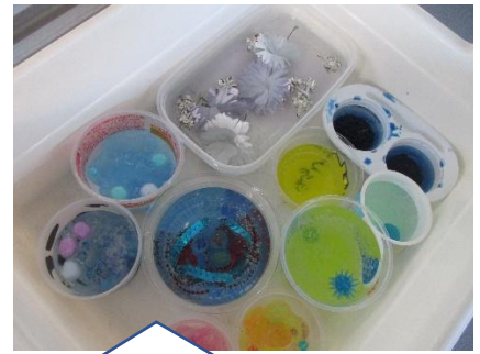
自分の好きな色や飾りを工夫して、素敵な氷を作りました。