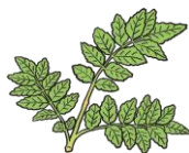
さんしょう 山椒の葉

食事の場で自然の美しさや四季の移ろいを表現することも特徴のひとつです。季節の花や葉などで料理を飾りつけたり、季節に合った調度品や器を利用したりして、季節感を楽しみます。