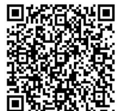
いじめ防止等基本方針