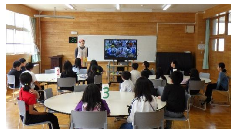
↑ランチルーム給食の様子

食べ物が自分の口に入るまでに、どれだけの人が関わり、どれほどの愛情が注がれているかを知り、感謝の心を育むことはとても大切な食育のひとつです。ランチルームでの経験を通じて、子どもたちには作ってくれた人、片付けてくれる人への感謝を、言葉だけでなく行動でも表せる人になってほしいと思っています。学校では、これからも給食という生きた教材を通して、子どもたちの健やかな体と、豊かな心を育ててまいりますので、今後ともどうぞよろしくお願いいたします。