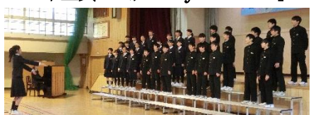
2 年 金 賞 1 組 「消えた八月」