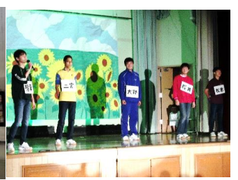
3 年 1 組 オープニング・ステージ