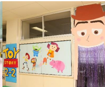
2 年 2 組 トイストーリー 2 の 2