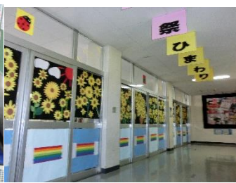
1 年 1 組 玄関装飾