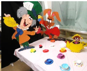
1 年 2 組 Alice in Nikumi-land