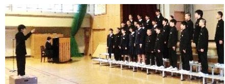
1 年 金 賞 2 組 「My own road」