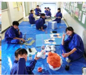
3 年 2 組 ハム太郎ハウス準備中