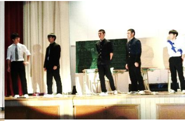
3 年 3 組 3 年 C 組