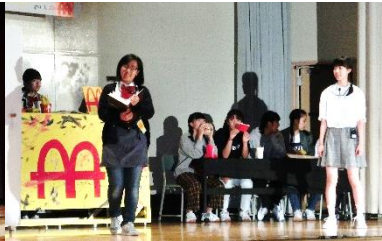
2 年 1 組 ハンバーガーショップの野望