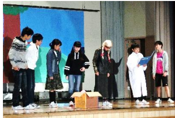
1 年 3 組 幕の内弁当