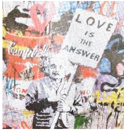
4 組点描画 Love is the answer