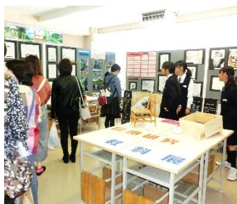
美術部・美術教科展 技術教科展