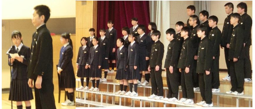
3 年 金 賞 1 組 「花をさがす少女」