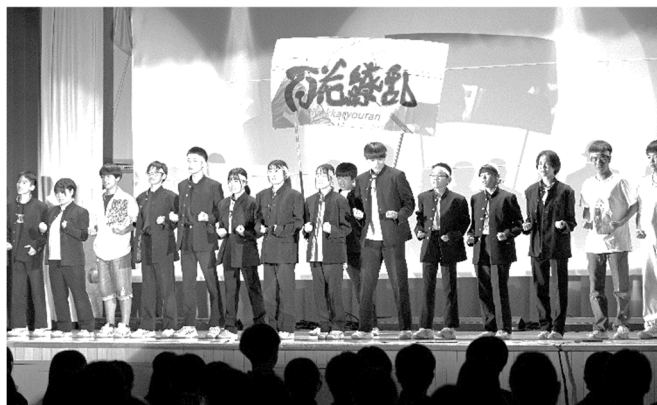
学 校 祭

したがって、一つの学年に4～6人の教師が所属して受け持つこととなり、学年教師全員が一人一人の生徒について様々な角度から指導にあたります。