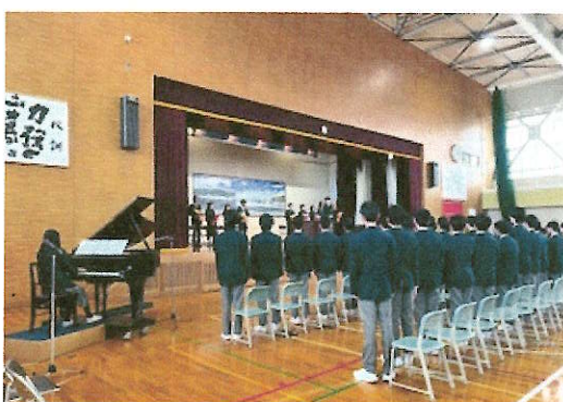
3月25日 修了式・離任式 離任式での「旅立ちの日に」の合唱