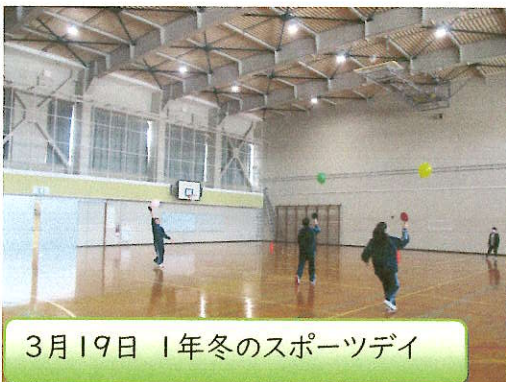
3月19日 1年冬のスポーツデイ