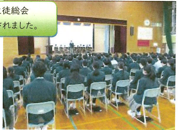
2月21日 後期生徒総会 色々な意見が出されました。