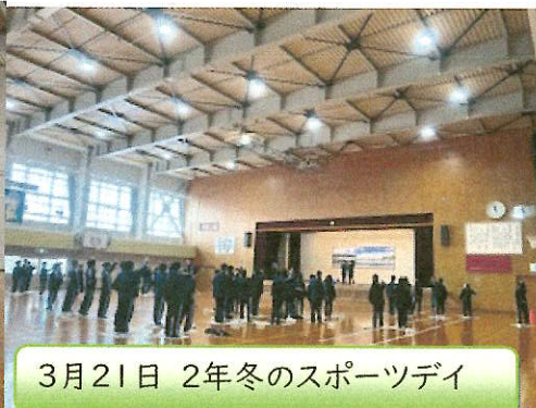
3月21日 2年冬のスポーツデイ