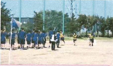
9月6日 体育大会 体育館とグラウンドで競技を行いました。