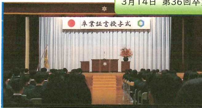
3月14日 第36回卒業証書授与式