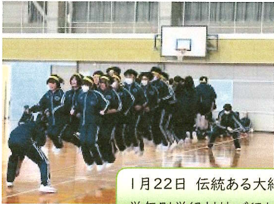
1月22日 伝統ある大縄跳び大会。 学年別学級対抗で行われました。