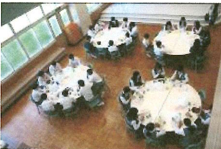
9月26日 学校祭 PTAの方がランチバザーを用意してくださいました。