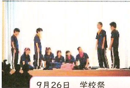
9月26日 学校祭 ステージで学年ごとの演劇がありました。