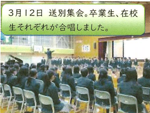
3月12日 送別集会。卒業生、在校 生それぞれが合唱しました。