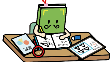
【読書】キャラクター「おっほん」