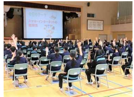
↑ 非行防止教室の様子

今年度の本会役員について、一部を御紹介します。地域の皆様とさまざまな機会に直接お会いできる日が来ることを願い、楽しみにしております。