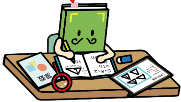
【読書】キャラクター「おっほん」