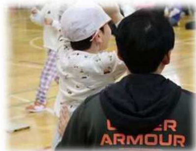
なわ跳び大会1年生、長なわ跳びにて…

本校では、日々の授業においても、生徒指導においても、まず子ども一人一人の姿を丁寧に見取り、理解することを大切にしています。子どもが愉しく学ぶために、多様な子どもたちが安心して過ごすために、どの場面でも「この子にとってどうか」を問い続けています。授業も生徒指導も、その出発点は同じです。これからも、子ども理解を土台に、学校全体で学び合い、支え合う学校づくりを進めていきたいと考えています。