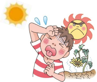
きおん たか ひ 気温が高い日