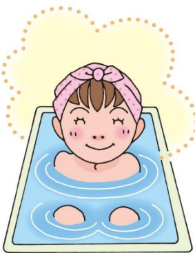
ゆふね 湯船につかる