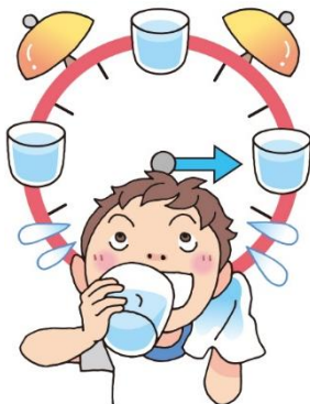
すいぶん ぼきゅう こまめに水分補給