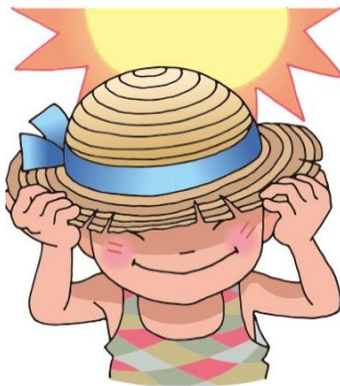
ぼうし 帽子をかぶる