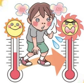
きゅう あつ ひ 急に暑くなった日