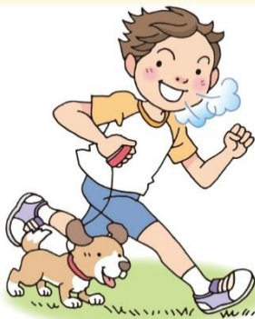
かる うんどう を する 軽い運動をする