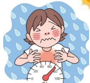
しつど たか ひ 湿度が高い日