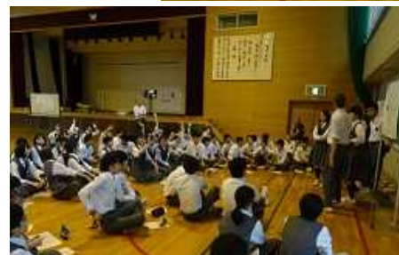
学校祭テーマ会議の様子