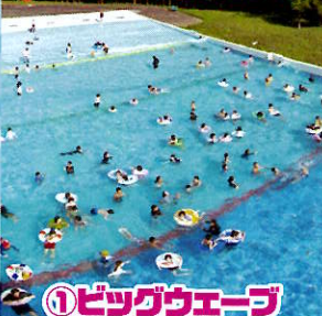
①ビッグウェーブ (波のプール)