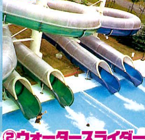
②ウォーターライダー