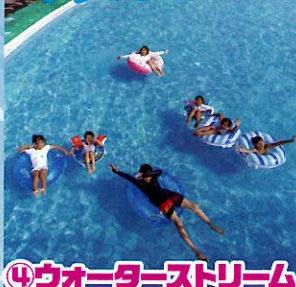
④ウォーターストリーム (流れるプール)