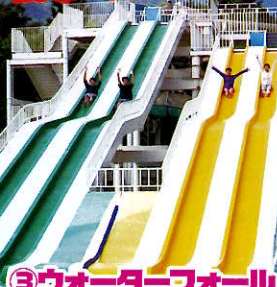
③ウォーターフォール