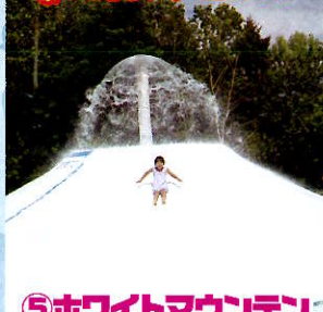
⑤ホワイトマウンテン