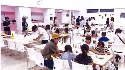
昨年のキッズフェスタのようす