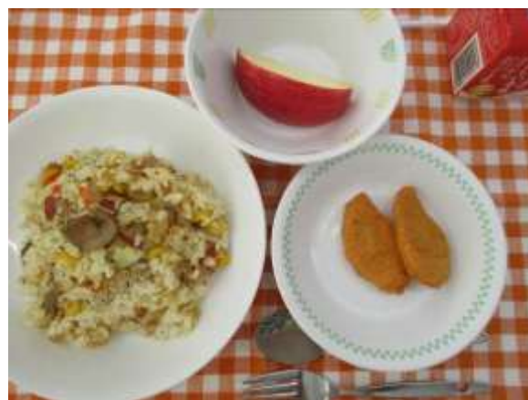
コーンピラフ、チキンナゲット、りんご、牛乳

1年生の給食が始まりました。先生の話をよく聞きながら、一生懸命に準備する姿がとても立派で、少し緊張しながらも、給食を楽しみにしている様子が伝わってきました。小学校の6年間で、様々な食べ物を味わい、心も体も大きく育ってほしいと願っています。