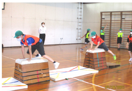
6年生集団跳びの様子

6年生の跳び箱運動では、集団跳びに挑戦しました。個人の技能を高めるだけでなく、チームで一つの演技をつくることで、互いにアドバイスをしたり、練習方法を共有したりと、子どもたち同士が自然と関わり合いながら増えていきました。友達と関わることで、今までできなかった技ができるようになった姿もたくさん見ることができました。