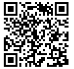
第1回学校運営協議会記録

後半は当日行われた札教研集会で話題となった今日的な2つの課題についてグループ毎に選択しての熟議となりました。