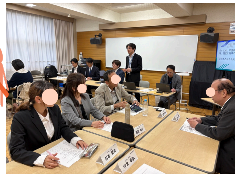
各グループのテーマと話し合いの内容