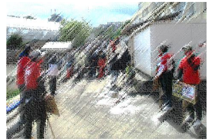
6月の運動会の様子