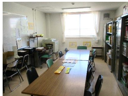
PTA会議室 南月寒小学校4階