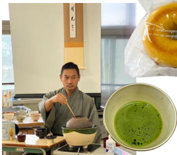
いちばん人気はPTA会長による淹れたてお抹茶。