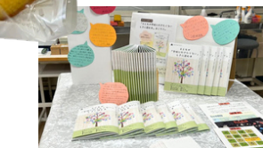
「子どもが学校に行きたくないときに読む本」カフェ内で配布しました。