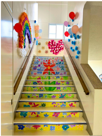
見事な階段の装飾に保護者も感動しました

保護者の居場所になればと開催したカフェや制服リサイクル・フリーマーケットの準備や当日のお手伝いへのご協力・ご来場、誠にありがとうございました。次頁に会計・小冊子の報告を添付します