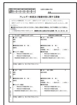
□アレルギー疾患及び健康状態に関する調査