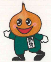
東豊高校マスコットキャラ 豊たろう