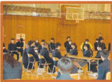
進路実現のための 3年生面接指導集会