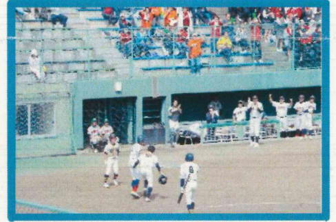
高野連札幌支部予選 Iブロック 準優勝(4校連合チーム)