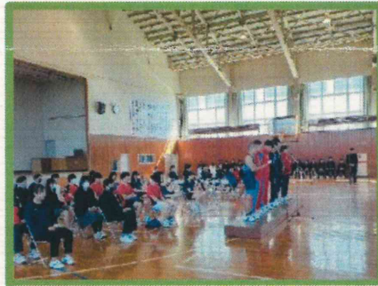
高体連・高文連・高野連大会 壮行会