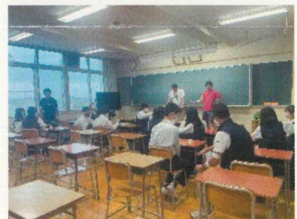
昨年の学校説明会の様子