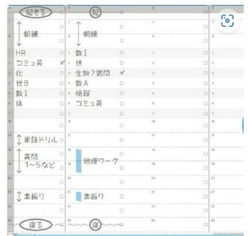
(フォーサイトの記入例)