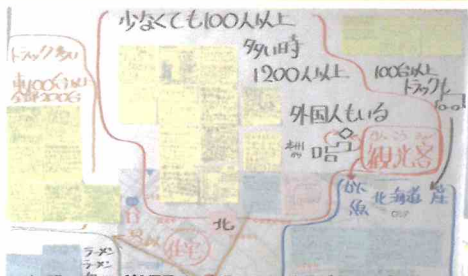
イチイの学習で行った調査の結果をまとめました。

学年だよりでもお知らせしましたが、基本の服装は短パン、Tシャツです。しかし、綱引きは長袖、長ズボンで競技に参加します。軍手は着きたい人は、着けても大丈夫です。すぐに着たり脱いだりしやすいようなジャージの上下のような服装がおすすめです。