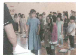
あいさつプロジェクトの言葉もすてきでした！