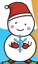
札幌らしい特色ある学校教育 【雪】キャラクター「ゆっぼろ」