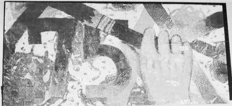
全校共同制作（体育館ステージ）